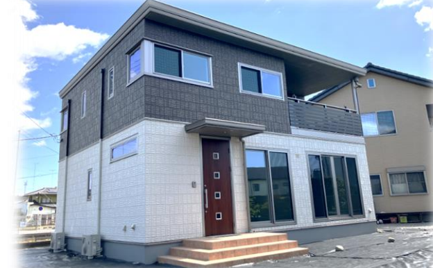
現地外観(南西側)※街並み含む 掲載写真 2023年5月撮影